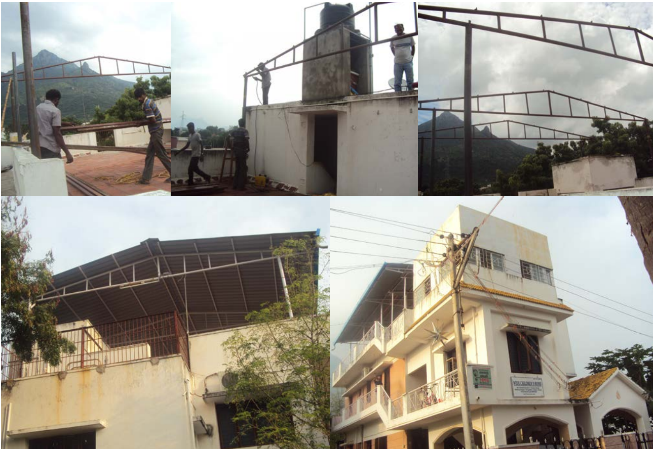
Mannen aan het werk om de frame van de dak-overkapping te plaatsen en het eindresultaat.

Bij de aankoop van het huis wisten we dat er op den duur een dakopbouw zou moeten komen voor op het platte dak. Het dak wordt namelijk gebruikt als de gezamenlijk ruimte om bijvoorbeeld te eten. Met een overkapping kan dat nu ook tijdens het regenseizoen! Deze extra oppervlakte is bovendien nodig om te voldoen aan de eisen van het minimale aantal vierkante meters voor 30 kinderen. Dit is een hele grote klus die over meerdere jaren uitgespreid zal worden. Dit jaar zijn die eerste stappen gezet: het frame voor de overkapping en de overkapping zelf. In een later stadium wordt de zijkant afgesloten met ramen en komt er een tweede plafond zodat de warme goed afgevoerd kan worden in de hete zomermaanden. De totale begroting voor dit project ligt zo rond de € 8.000. Deze kosten zullen met andere sponsors en/of organisaties gedeeld worden. Kumari heeft al een sponsor gevonden voor maar liefst ongeveer € 3.000, wat genoeg is voor de eerste fase van de bouw!